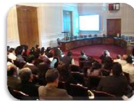
30 de Septiembre 2011