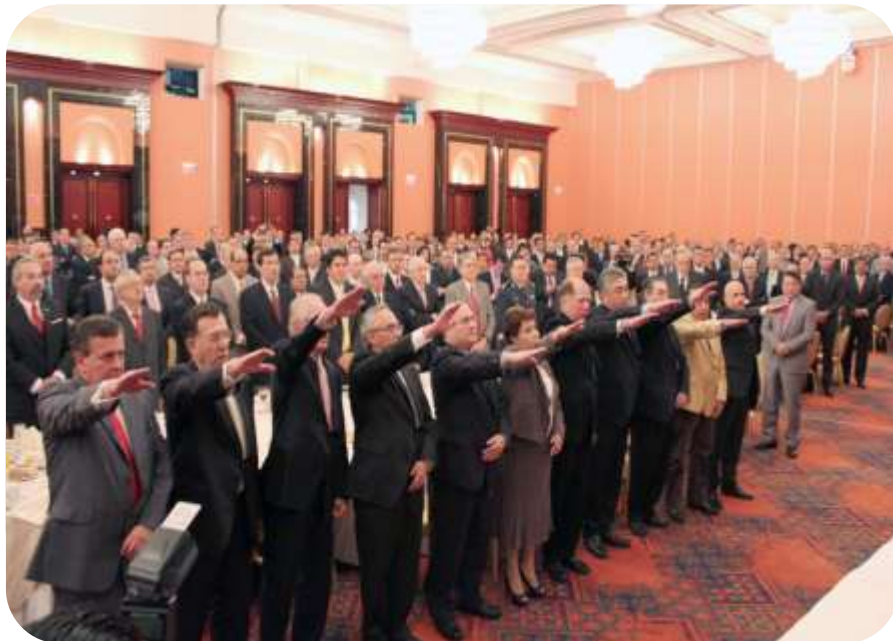
Desayuno Institucional Lugar: Hotel Nikko