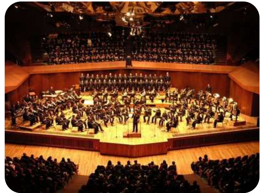
Concierto de Gala Lugar: Sala Netzahualcóyotl