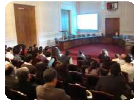
30 de Septiembre 2011